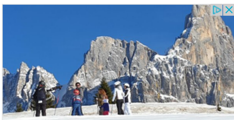
San Martino di Castrozza centro benessere con sauna infrarossi, sauna finlandese, idromassaggio, bagno turco albergoeden.it

DAL MUSEI DI TRENTO AL CENTRO SAINT-BÉNIN DI AOSTA (CON UNA PUNTATA A TORINO), SONO TANTI I MUSEI DELLE REGIONI ALPINE ITALIANE CHE OSPITANO EVENTI, RASSEGNE E MOSTRE DAL TAGLIO INEDITO QUESTA ESTATE. ECCONE UNA SELEZIONE.